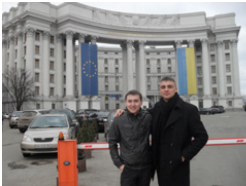
Наші студенти біля Міністерства закордонних справ

У період з 22.03.2010 р. по 18.04.2010 р. студенти 4-го курсу проходили професійну практику в Міністерстві закордонних справ України , Міністерстві економіки України та в Головному управлінні зовнішньоекономічних зв'язків та євроінтеграції Харківської обласної державної адміністрації .