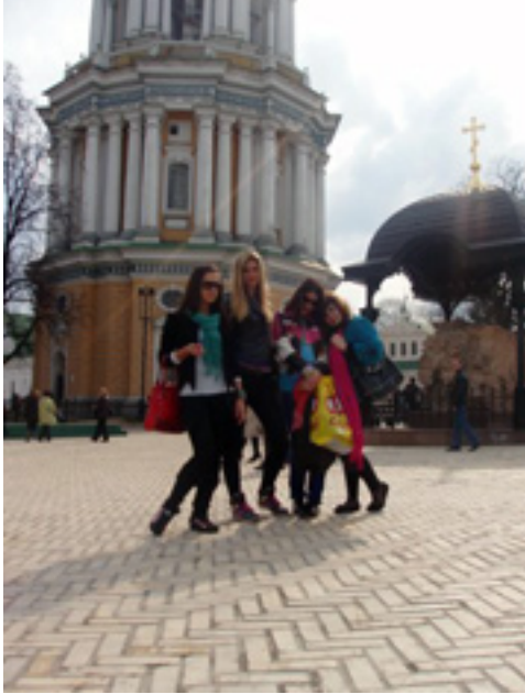
Гуляють вулицями столиці

У відділі країн Близького Сходу третього територіального депар-